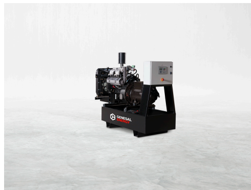
A= 1750 mm B= 2550 mm C= 1020 mm

Ejecución estándar. Bajo demanda, este equipo podrá ser fabricado de forma personalizada. Los productos GENESAL ENERGY pueden ser modificados sin previo aviso por evolución tecnológica.